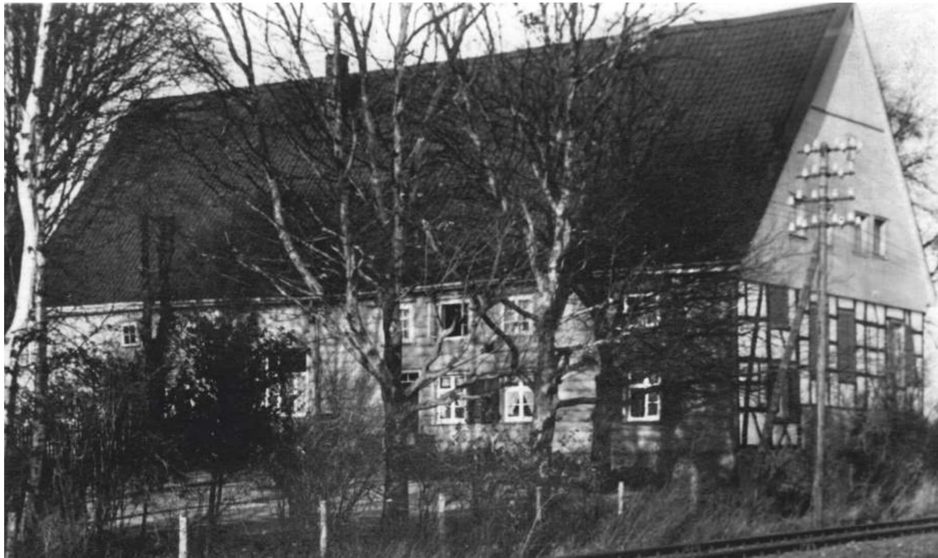
Hof Drenhaus um 1940 (Ansicht aus Südwest)

Die Silbe „-haus“, „-hausen“ bzw. „-husen“ deutet auf eine ältere Ansiedlung hin, die wahrscheinlich nicht nur einen Hof umfasst hat. Die Silbe „Dren, Drein oder Drin“ beschreibt die Lage der Siedlung an einer moorigen bzw. sumpfigen Niederung. Eine andere Erklärung nimmt Bezug auf die Anzahl von drei Häusern (mnd. „drên husen“). Erste Erwähnung findet der Name bereits um 1220. Der Hof gehörte ursprünglich den Grafen von Isenberg , bevor er an das Stift Rellinghausen und später an das Stift Herdecke gelangte.