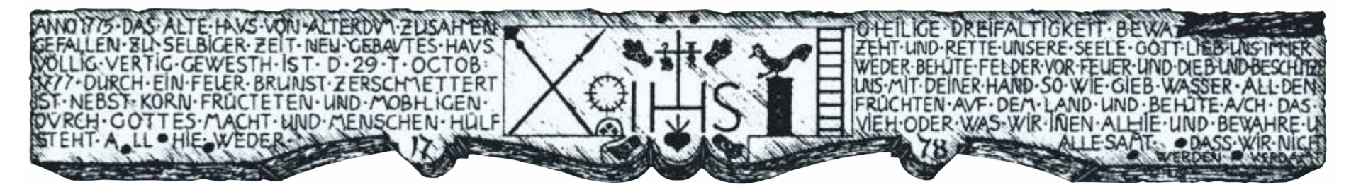
Alter Torbalken von 1778 mit Inschrift (© Zeichnung: Helmut Laaser)

Heimatgeschichtskreis Eiberg www.eiberg-heimatgeschichtskreis.de